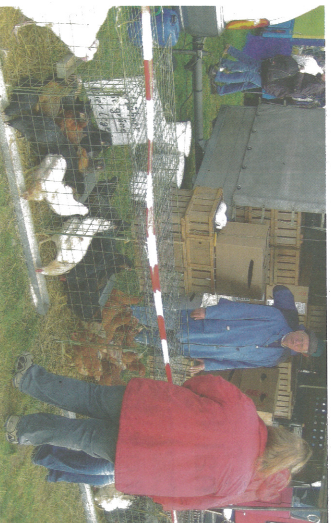
Viel zu sehen gibt es beim traditionsreichen Düstermühlenmarkt.